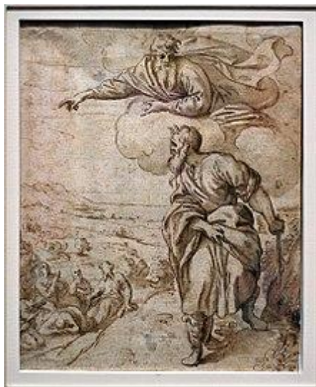
Yahweh (God) shows Moses the Promised Land ( Frans Pourbus the Elder , c. 1565–80)

The Promised Land ( Hebrew : הארץ המובטחת, translit. : ha'aretz hamuvtakhat ; Arabic : أرض الميعاد, translit. : ard al-mi'ad ; also known as "The Land of Milk and Honey") is the land that according to the Tanakh (the Hebrew Bible or the Old Testament ), God promised and subsequently gave to Abraham and several more times to his descendants . In modern contexts, the phrase "Promised Land" expresses an image and an idea that is related to the restored homeland for the Jewish people and the concepts of salvation and liberation.